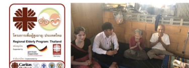
โครงการเพื่อผู้สูงอายุ : สังฆมณฑลเชียงราย นำทีมออกเยี่ยมผู้ป่วยติดบ้าน ติดเตียง