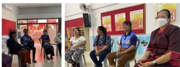
โครงการเพื่อผู้สูงอายุ : สังฆมณฑลเชียงราย จัดประชุมแกนนำดูแลผู้สูงอายุและออกเยี่ยม

จิตตาทิบาลผู้สูงอายุฯ กลุ่มแกนนำดูแลผู้สูงอายุ ออกเยี่ยมผู้สูงอายุ ผู้ป่วยติดบ้าน-ติดเตียง จัดกิจกรรมฯ