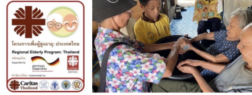
โครงการเพื่อผู้สูงอายุ : สังฆมณฑลเชียงราย ออกเยี่ยมท่าความสะอาดเท้า มือและใจ