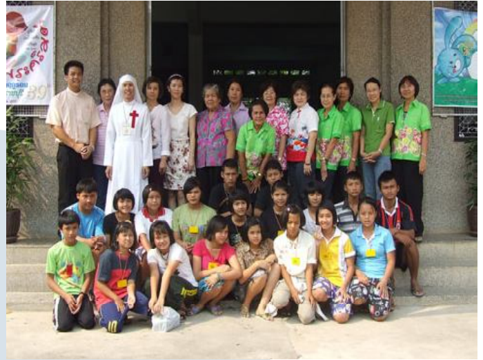
กิจกรรมในครั้งนี้จำนวน 50 คน ที่โรงเรียนตรุณาราชบุรี จังหวัดราชบุรี