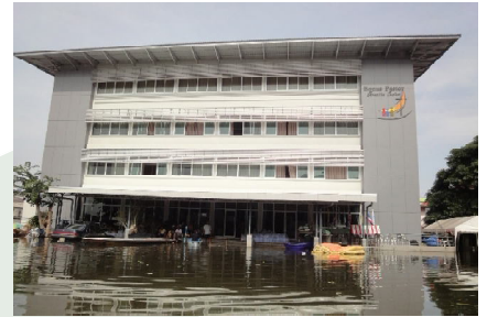
สภาพน้ำท่วมบริเวณหน้าอาคารโบนชูช อาคารเอนกประสงค์